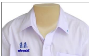
การปัก ส.ส. และเลขประจำตัว ม.ต้น

๓.๑.๒ เสื้อ เป็นเสื้อเชิ้ตคอตั้ง ผ้าขาวเกลี้ยงไม่มีลวดลาย ไม่บางเกินสมควรห้ามใช้ ผ้าแพร หรือผ้าที่ไม่สามารถรักษารูปทรงเอาไว้ได้ ผ่าอกตลอดมีسابหน้าพับด้านนอก กว้าง ๔ เซนติเมตร กระดุมสีขาวกลม ขนาดเส้นผ่านศูนย์กลางไม่เกิน ๑ เซนติเมตร แขนสั้นเพียงข้อศอก มีกระเป๋าด้านตรงระดับบราวนม เบื้องซ้าย ๑ กระเป๋า ขนาดกว้าง ๘ – ๑๒ เซนติเมตร ลึก ๑๐ – ๑๕ เซนติเมตร พอเหมาะกับขนาดของเสื้อ ปักอักษร ส.ส. และเลขประจำตัวด้วยไหมสีน้ำเงินตามขนาดและแบบของโรงเรียนที่หน้าอกเสื้อเบื้องขวา ระดับ กระเป๋าซึ่งอยู่ด้านซ้าย สำหรับนักเรียนชั้นมัธยมศึกษาตอนปลาย (ม.๔, ๕ และ ๖) จะต้องปักเครื่องหมายโรงเรียนเหนืออักษร ส.ส. ด้วยไหมสีน้ำเงิน บริเวณขอบปกเสื้อด้านซ้ายตอนปลายให้ปักด้วยไหมตามสีของคณะที่สังกัดในแต่ละปีการศึกษาเป็นวงกลมทึบ ขนาดเส้นผ่านศูนย์กลาง ๐.๕ เซนติเมตร เพื่อบอกชั้นเรียน ชั้น ม. ๑, ม. ๔ ปัก ๑ วง ม. ๒, ม. ๕ ปัก ๒ วง ม. ๓, ม. ๖ ปัก ๓ วง เรียงเป็นแนวตามขอบปกเสื้อและสอดชายเสื้อไว้ในกางเกงให้เรียบร้อยจนสามารถมองเห็นเข็มขัดได้อย่างชัดเจนตลอดทั้งเส้น