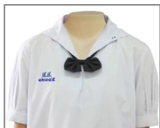
การปัก ส.ส. และเลขประจำตัว

๓.๒.๑.๑ เสื้อี ผ้าขาวเกลี้ยง ไม่บางเกินสมควร ไม่มีลวดลาย ห้ามใช้ผ้าแพร หรือผ้าที่บางและไม่สามารถรักษารูปทรงเอาไว้ ตัวเสื้อเป็นแบบคอพับในตัวลึกลงสวมศีรษะเข้าได้สะดวก สาบตลบเข้าข้างใน มีปกขนาด ๑๐ เซนติเมตร ใช้ผ้าเย็บแบบเข้าถ้ำ (คอปกทหารเรือ) แขนสั้นเพียงข้อศอก ปลายแขนจีบเล็กน้อยพับขอบประกอบด้วยผ้าสองชั้นกว้าง ๓ เซนติเมตร ชายเสื้อด้านล่างพับขอบเข้าในกว้าง ๓ เซนติเมตร ขนาดตัวเสื้อกว้างพอเหมาะกับลำตัวไม่รัดเอว ที่ริมขอบด้านล่างขวา ติดกระเปาะขนาดกว้าง ๕ - ๙ เซนติเมตร ลึก ๗ - ๑๐ เซนติเมตร ปักอักษรย่อ ส.ส. และเลขประจำตัวด้วยไหมสีน้ำเงินตามขนาด และแบบของโรงเรียน ที่หน้าอกเสื้อเบื้องขวา ชายเสื้อไว้นอกกระโปรงยาวลงมาไม่เกินนิ้วหัวแม่มือ (เมื่อยืนปล่อยแขนตรง) บริเวณขอบปกเสื้อด้านซ้ายให้ปักด้วยไหมตามสีของคณะที่สังกัดในแต่ละปีการศึกษา เป็นวงกลมที่ขนาดเส้นผ่านศูนย์กลาง ๐.๕ เซนติเมตร เพื่อบอกชั้นเรียน ม. ๑ ปัก ๑ วง ม. ๒ ปัก ๒ วง ม. ๓ ปัก ๓ วง