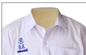
การปัก ส.ส. และเลขประจำตัว ม.ปลาย