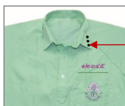
ปกเสื้อพละนักเรียนชาย ม.ต้น

ขนาด และแบบของโรงเรียน ด้วยไหมสีชมพูเข้ม ที่บริเวณปกเสื้อด้านซ้ายตอนบนให้ปักเครื่องหมายบอกคณะสีและระดับชั้นเรียน โดยนักเรียนมัธยมศึกษาตอนต้นปักเช่นเดียวกับเสื้อนักเรียนสีขา นักเรียนมัธยมศึกษาตอนปลายให้ปักเป็นขีดทึบใช้ไหมปักตามสีของคณะที่สังกัด ขนาดความกว้าง ๐.๒ เซนติเมตร ความยาว ๑ เซนติเมตร ม. ๔ ปัก ๑ ขีด ม. ๕ ปัก ๒ ขีด และ ม. ๖ ปัก ๓ ขีด