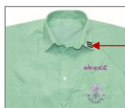
ปกเสื้อพละนักเรียนชาย ม.ปลาย

- กางเกงพละ ใช้กางเกงวอร์มตามที่โรงเรียนกำหนด สีกรมท่ามีแถบข้าง สีชมพู - เขียว และใช้แต่งในชั่วโมงพลศึกษาเท่านั้น