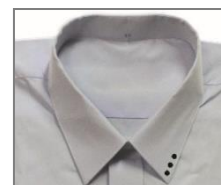
การปักวงกลม ปกเสื้อนักเรียน

๓.๑.๓ เข็มขัด เป็นเข็มขัดหนังสีน้ำตาลพื้นเรียบ ขนาดกว้าง ๓ – ๔ เซนติเมตร ยาวตามส่วนขนาดตัวของนักเรียน หัวเข็มขัดเป็นโลหะสีทองรูปสี่เหลี่ยมผืนผ้า ชนิดกลัดที่มีกลัดอันเดียว ๑ ปลอก ขนาดกว้าง ๑.๕ เซนติเมตร สำหรับสอดปลายเข็มขัด เข็มขัดสอดไปในห่วงกางเกง การสวมห้ามหันกลับเอา ด้านในออก ห้ามขีดเขียน หรือทำเครื่องหมายใด ๆ บนเข็มขัด