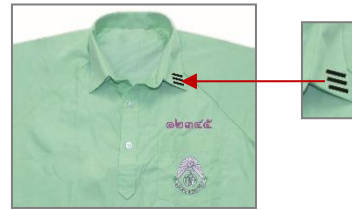
ปกเสื้อพละนักเรียนชาย ม.ปลาย