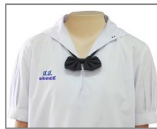
การปัก ส.ส. และเลขประจำตัว

ผ้าขาวเกลี้ยง ไม่บางเกินสมควร ไม่มีลวดลาย ห้ามใช้ผ้าแพร หรือผ้าที่บางและไม่สามารถรักษารูปทรงเอาไว้ ตัวเสื้อเป็นแบบคอพับในตัวลิกพอสวมศีรษะเข้าได้สะดวก สาบตลบเข้าข้างใน มีปกขนาด ๑๐ เซนติเมตร ใช้ผ้าเย็บแบบเข้าถ้ำ (คอปกทหารเรือ) แขนสั้นเพียงข้อศอก ปลายแขนจีบเล็กน้อยพับขอบประกอบด้วยผ้าสองชั้นกว้าง ๓ เซนติเมตร ชายเสื่อด้านล่างพับขอบเข้าในกว้าง ๓ เซนติเมตร ขนาดตัวเสื้อกว้างพอเหมาะกับลำตัวไม่รัดเอว ที่ริมขอบด้านล่างขวา ติดกระเป๋ายาวขนาดกว้าง ๕ - ๙ เซนติเมตร ลึก ๗ - ๑๐ เซนติเมตร ปักอักษรย่อ ส.ส. และเลขประจำตัวด้วยไหมสีน้ำเงินตามขนาด และแบบของโรงเรียน ที่หน้าอกเสื้อเบื้องขวา ชายเสื่อไว้นอกกระโปรงยาวลงมาไม่เกินนิ้วหัวแม่มือ (เมื่อยืนปล่อยแขนตรง) บริเวณขอบปกเสื้อด้านซ้ายให้ปักด้วยไหมตามสีของคณะที่สังกัดในแต่ละปีการศึกษา เป็นวงกลมที่ขนาดเส้นผ่านศูนย์กลาง ๐.๕ เซนติเมตร เพื่อบอกชั้นเรียน ม. ๑ ปัก ๑ วง ม. ๒ ปัก ๒ วง ม. ๓ ปัก ๓ วง