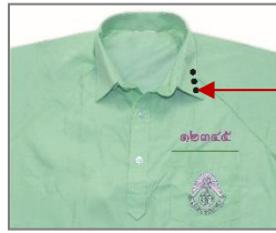
ปกเสื้อพละนักเรียนชาย ม.ต้น