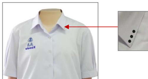
เสื้อนักเรียนหญิง ม.ปลาย

๓.๒.๒ ชั้นมัธยมศึกษาตอนปลาย (ม. ๔, ม. ๕, และ ม. ๖)